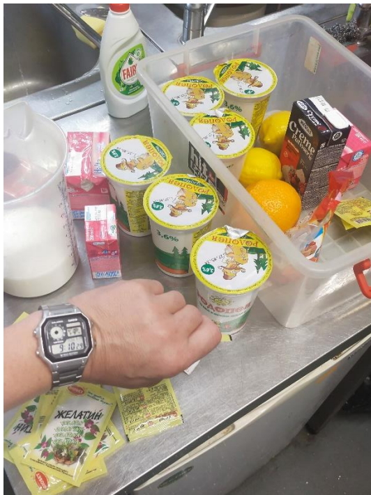
Reparto de ingredientes