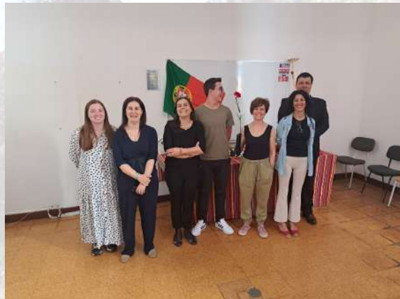
Fragmento de la presentación del alumnado: