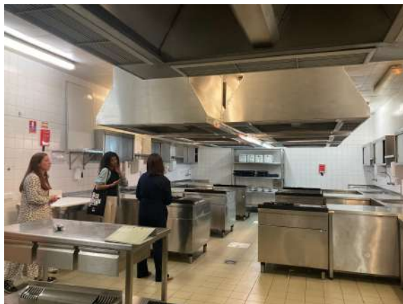
Cocinas para 2 curso